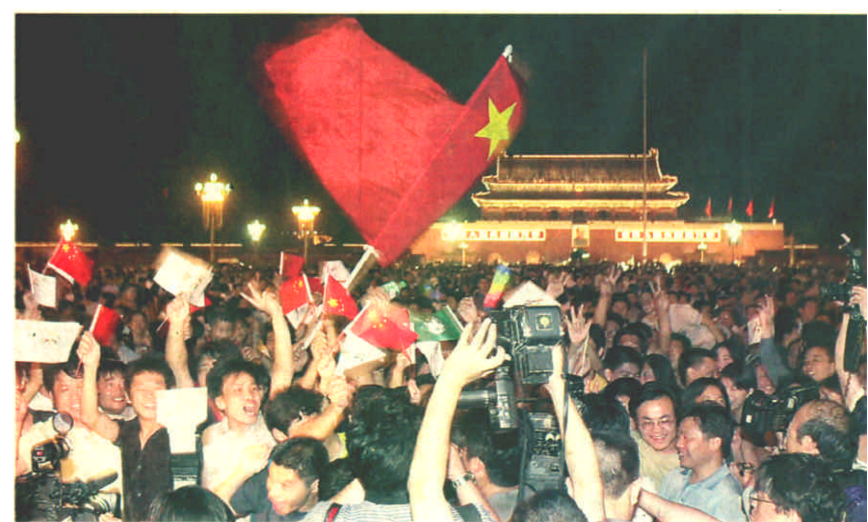
7月13日，2008年奥运会主办城市投票揭晓，北京赢啦！