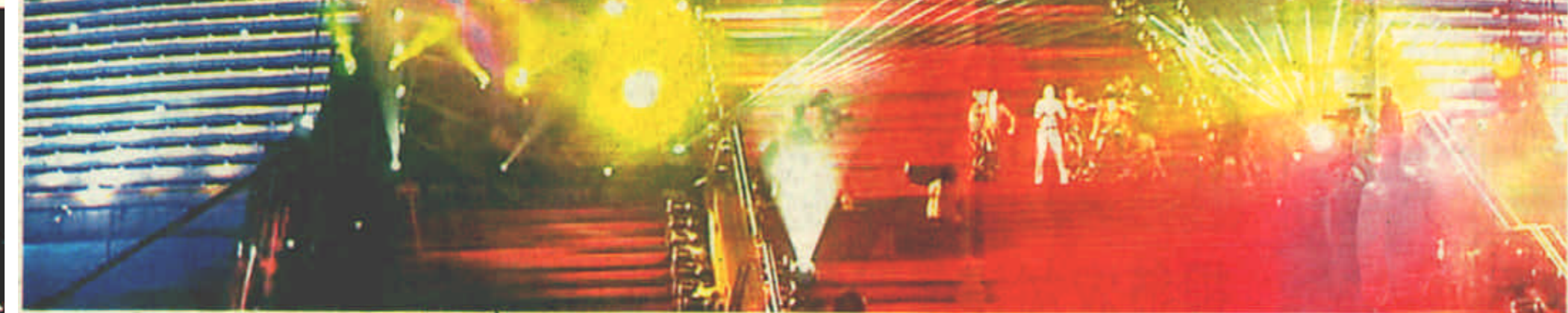
7月13日，国际奥委会第112次全会投票选出2008年奥运会主办城市——中国北京。这一天的晚上，北京城一片欢腾。北京世纪坛灯火通明。