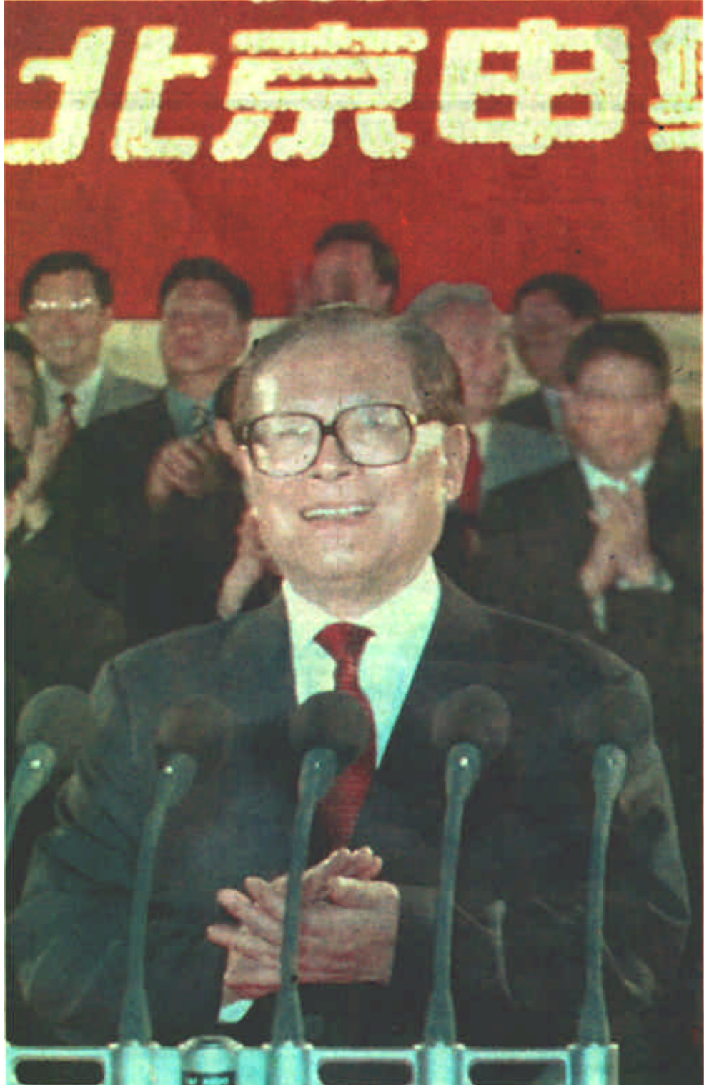
7月13日，中共中央总书记、国家主席、中央军委主席江泽民在北京中华世纪坛与各界群众欢庆北京申办奥运成功。江泽民同志向全场群众发表讲话。他说，我代表党中央、国务院，对北京申办奥运成功的祝贺！向全国人民为北京申奥所作的贡献表示感谢，向国际奥委会和各国朋友对北京申奥的支持表示感谢！全国人民将与首都人民一起奋发努力，扎实工作，把2008年奥运会办成功。江泽民同志在世纪坛和天安门广场，参加奥运会。