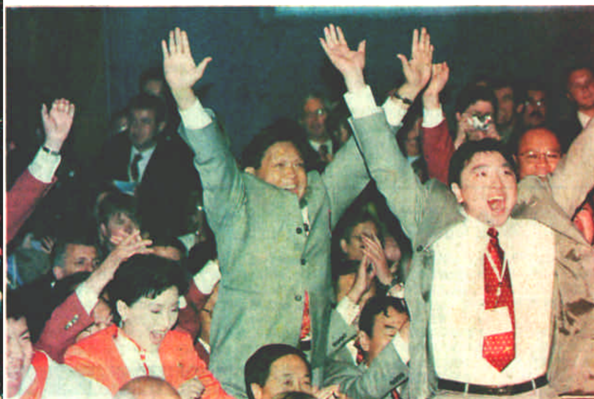
7月13日，在莫斯科举行的国际奥委会第112次全会上，国际奥委会主席萨马兰奇宣布，北京市获得2008年奥运会主办权。图为北京申奥代表团欢呼。