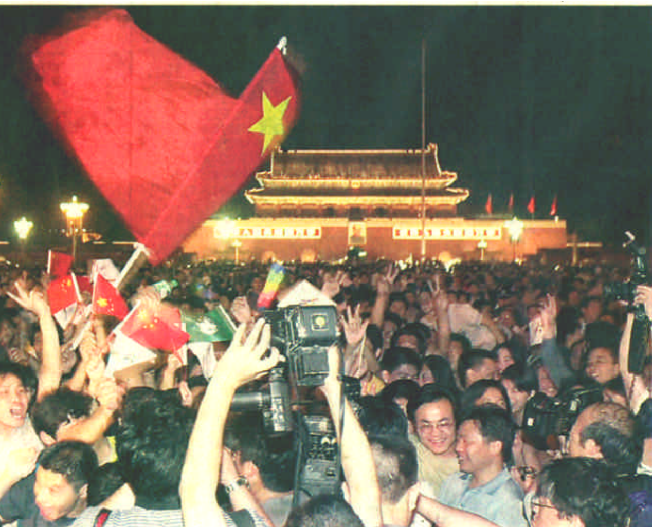
7月13日，2008年奥运会主办城市投票揭晓，北京赢了！