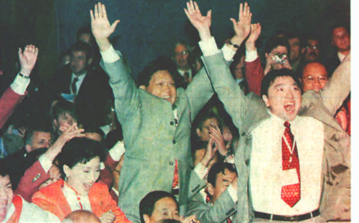
7月13日，在莫斯科举行的国际奥委会第112次全会上，国际奥委会主席萨马兰奇宣布，北京市获得2008年奥运会主办权。图为北京申奥代表团欢呼。

我代表党中央、国务院，对北京申办奥运成功的祝贺！向全国人民为北京申奥所作的贡献表示感谢，向国际奥委会和各国朋友对北京申奥的支持表示感谢！全国人民将与首都人民一起奋发努力，扎实工作，把2008年奥运会办成功。江泽民同志在世纪坛和天安门广场，参加奥运会。 主持晚会的贾庆林同志表示，我们将不负众望，把北京建设得更美好，把2008年奥运会办成奥运史上最精彩、最辉煌的一届奥运会。 在全城的欢庆声中，江泽民、李鹏、朱镕基、李瑞环、胡锦涛、尉健行等党和国家领导人驱车来到天安门广场，向聚集在广场上的40万各界群众招手致意。广场上，人们载歌载舞，挥动彩旗，纵情欢呼。随后，江泽民等党和国家领导人高兴地登上天安门城楼，观看满城的灯火和群众欢庆的场面，与人们共度这个美好的夜晚。