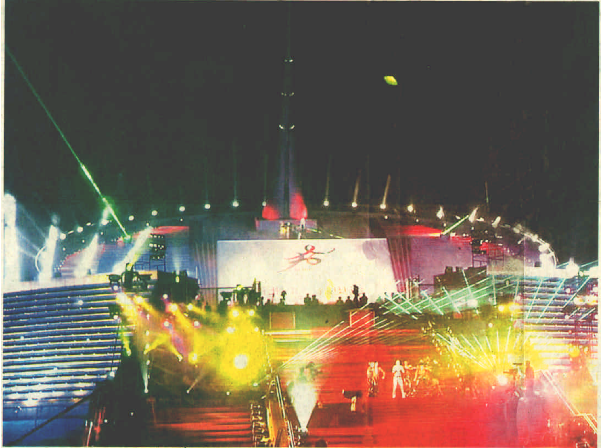
7月13日，国际奥委会第112次全会投票选出2008年奥运会主办城市——中国北京。这一天的晚上，北京城一片欢腾。北京世纪坛灯火通明。