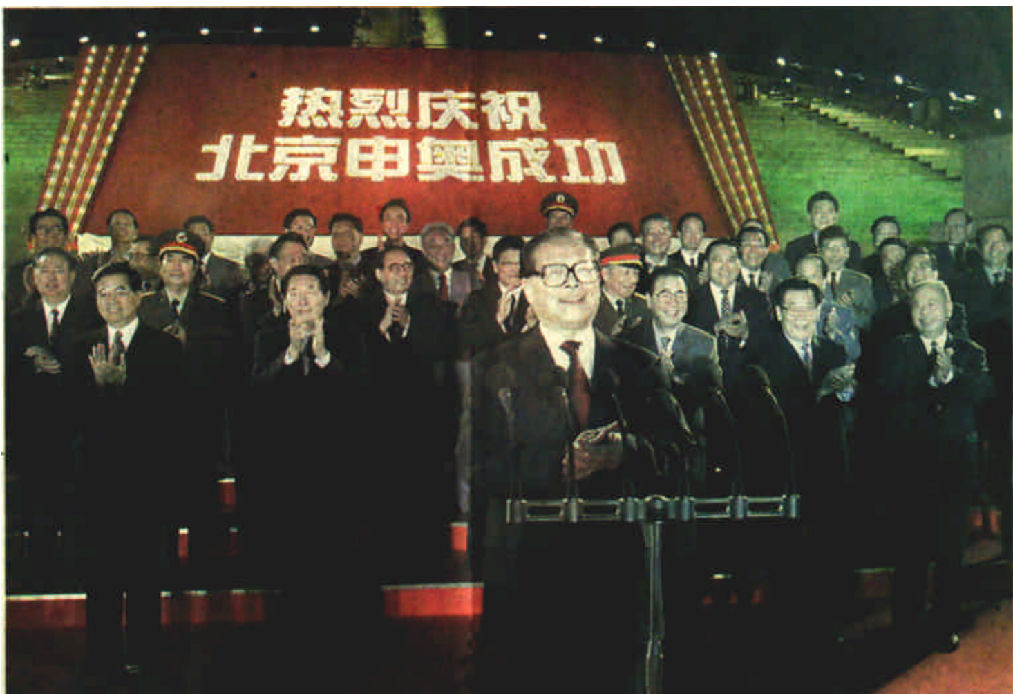
7月13日，江泽民、李鹏、朱镕基、李瑞环、胡锦涛、尉健行等在北京中华世纪坛与各界群众共庆北京申办奥运成功。