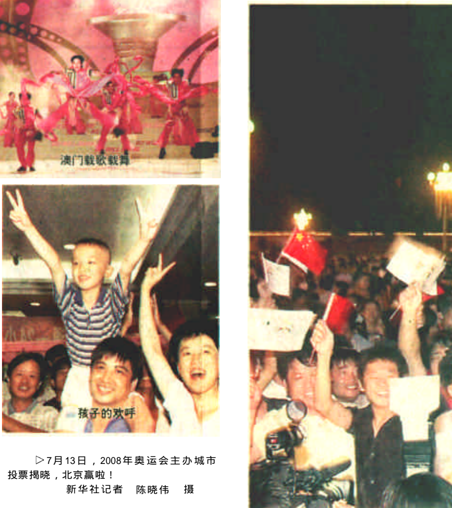
7月13日，2008年奥运会主办城市投票揭晓，北京赢了！